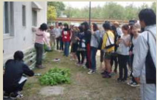
説明に耳を傾ける留学生や日本人学生

今後植物の栽培や生ごみコンポストの講座を開催し、自然の循環を体験してもらう予定です。