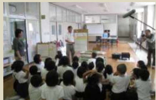
取材を受けながら行われた出前授業

小谷小学校・光和商事（株）主催、エコネットひがしひろしま共催事業として小学2年生を対象に出前授業が行われました。授業ではみみずと環境の話、みみず紙芝居、そしてミミズは何を食べるのかをテーマに10日間にわたる実験などが行われました。児童たちはミミズに興味津々で、愛おしく観察をしていました。また出来上がったミミズ堆肥をつかってミニトマトの植え付けを行い自然の循環を体験しました。