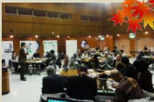
会員の活動報告で盛り上がった交流会

交流会には環境に配慮した軽食（国産小麦や米粉を使ったパンやラスク、サブシなど）が用意され、尽きることのない話で盛り上がり、親睦を深めることができました。